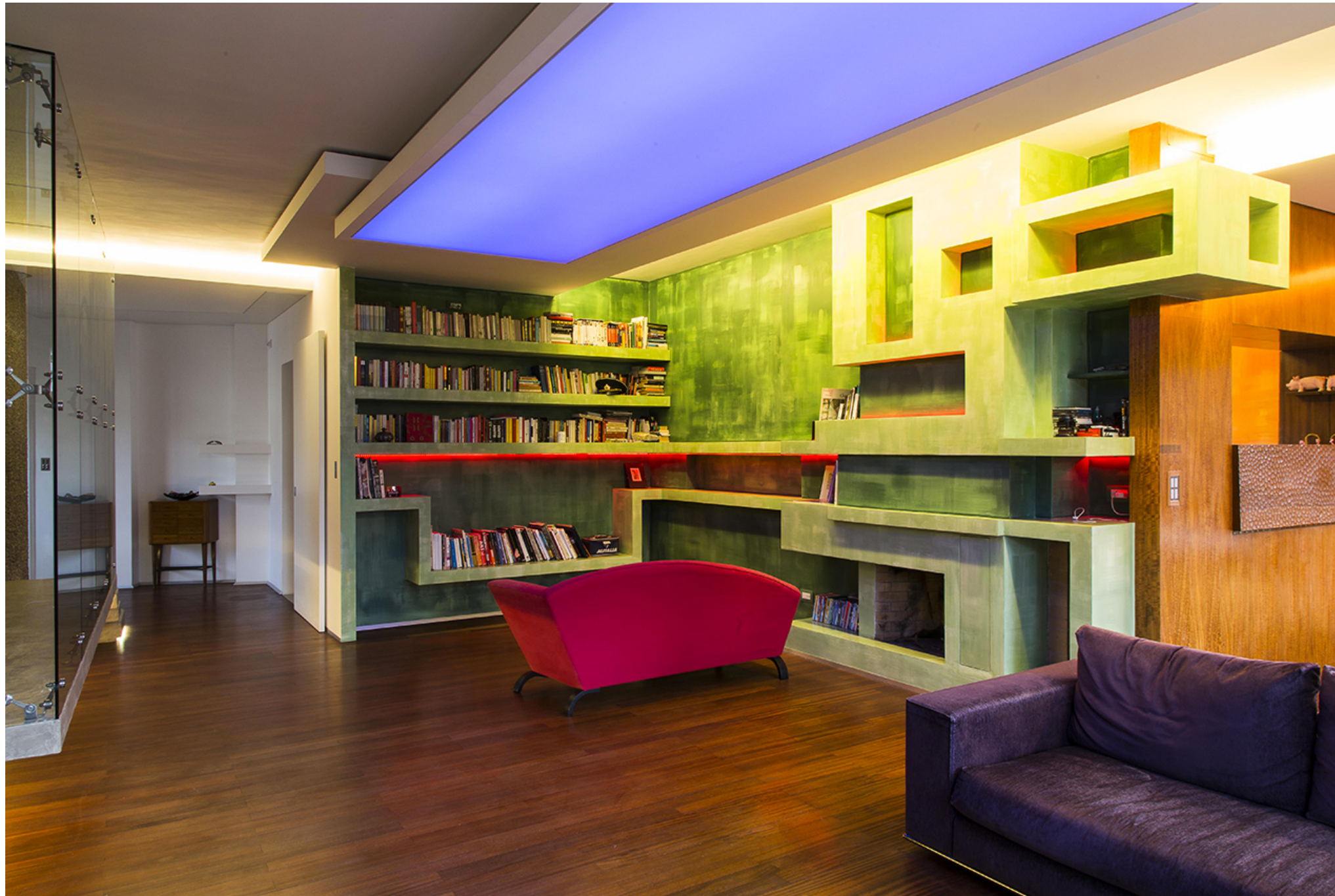
OfficinaLeonardo, 39-7 House

Abbiamo immaginato una forte presenza di un muro in cemento armato che fa da sostegno ad un ponte che da esso si origina e che ci proietta sul verde assoluto dell' antistante Villa Torlonia; questo muro attraversa la casa, si torce e si piega secondo geometrie nette che richiamano il razionalismo di una parte della palazzina, a formare questa passerella sospesa in vetro che conduce alla zona notte e qui si plasma nella sua parte più intima e segreta, d'accesso alle camere e ai bagni, adducendo