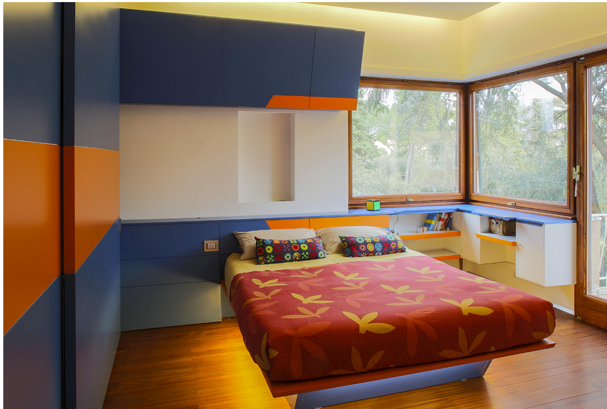
OfficinaLeonardo, 39-7 House

radianti per la climatizzazione sia invernale che estiva, e accoglie al tempo stesso tutta l'impiantistica idrica, elettrica e domotica. Questa scelta ha permesso di preservare il pregevole parquet in listoni di mogano degli anni '50.