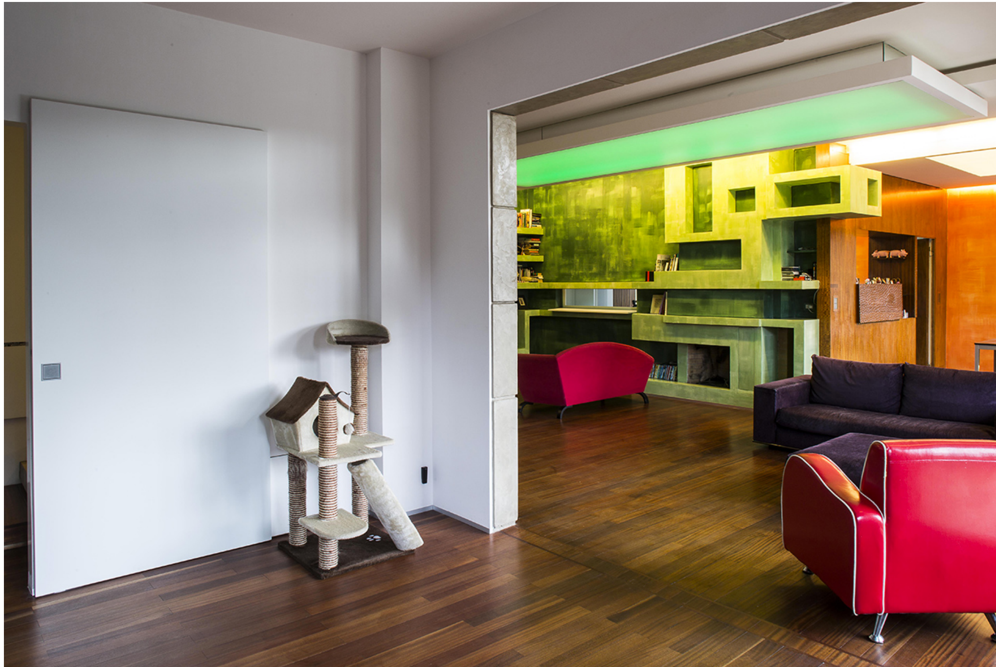
OfficinaLeonardo, 39-7 House

Più avanti lo stesso muro in conci di cemento si apre basculando verso l'alto, celato dalle fughe del muro, connettendo un altro spazio, una camera jolly che funge da studio, camera degli ospiti o gioco, e ampliando così sia fisicamente che visivamente il già ampio salone. Una spettacolare porta in muratura silenziosamente e rapidamente crea un piccolo spettacolo dinamico all'interno della casa.