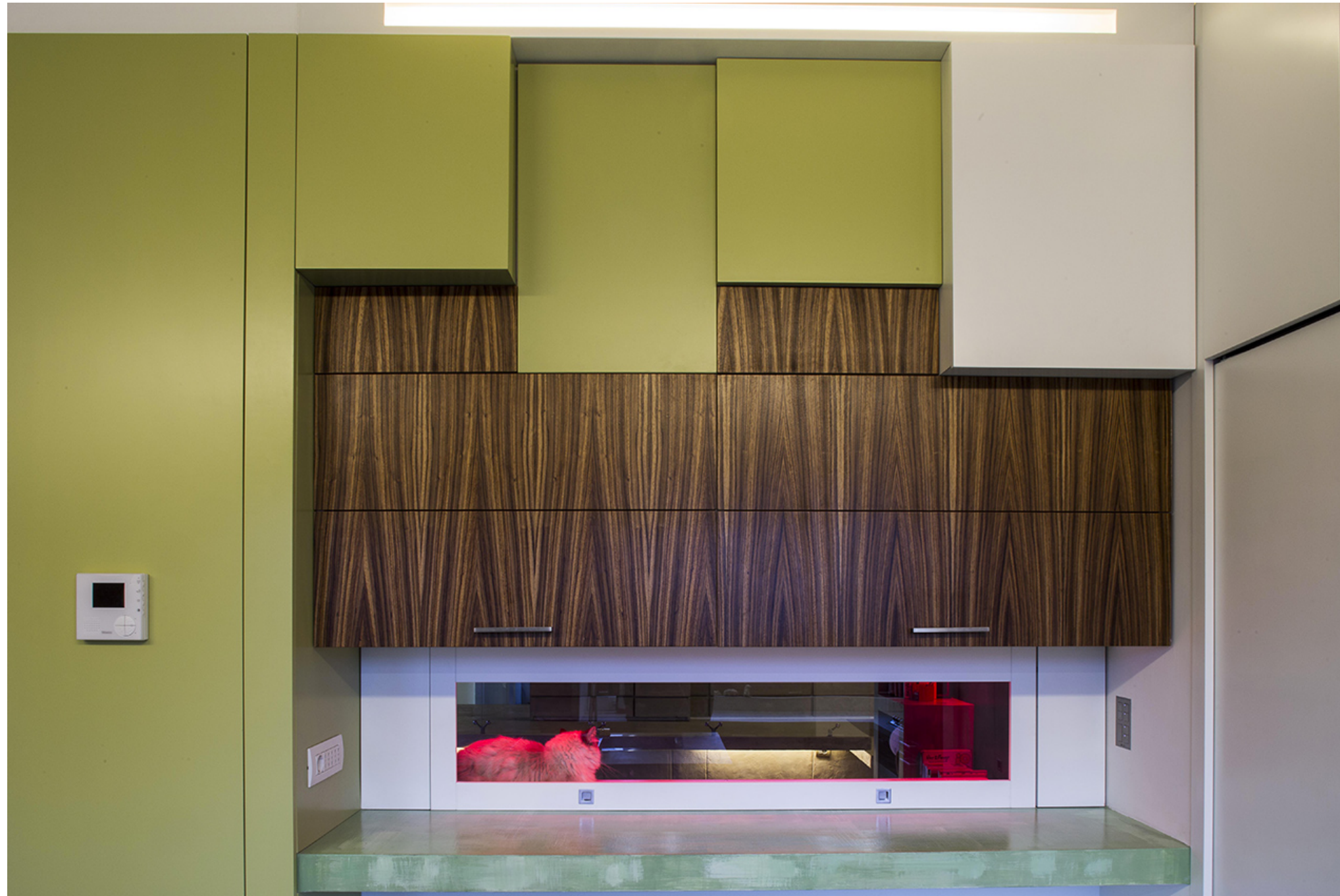
OfficinaLeonardo, 39-7 House

compiuta al bozzetto di una nuvola in cui si intravedono forme astratte di foglie autunnali. I richiami al mondo vegetale proseguono poi, sempre in forma astratta, nel salone in cui le pennellate di verde a trama lasciano intravedere una orditura di fogliame forestale, fino a far ritorno alla parete di cemento da cui tutto parte, lasciando una impronta casuale nella sua sezione finale.