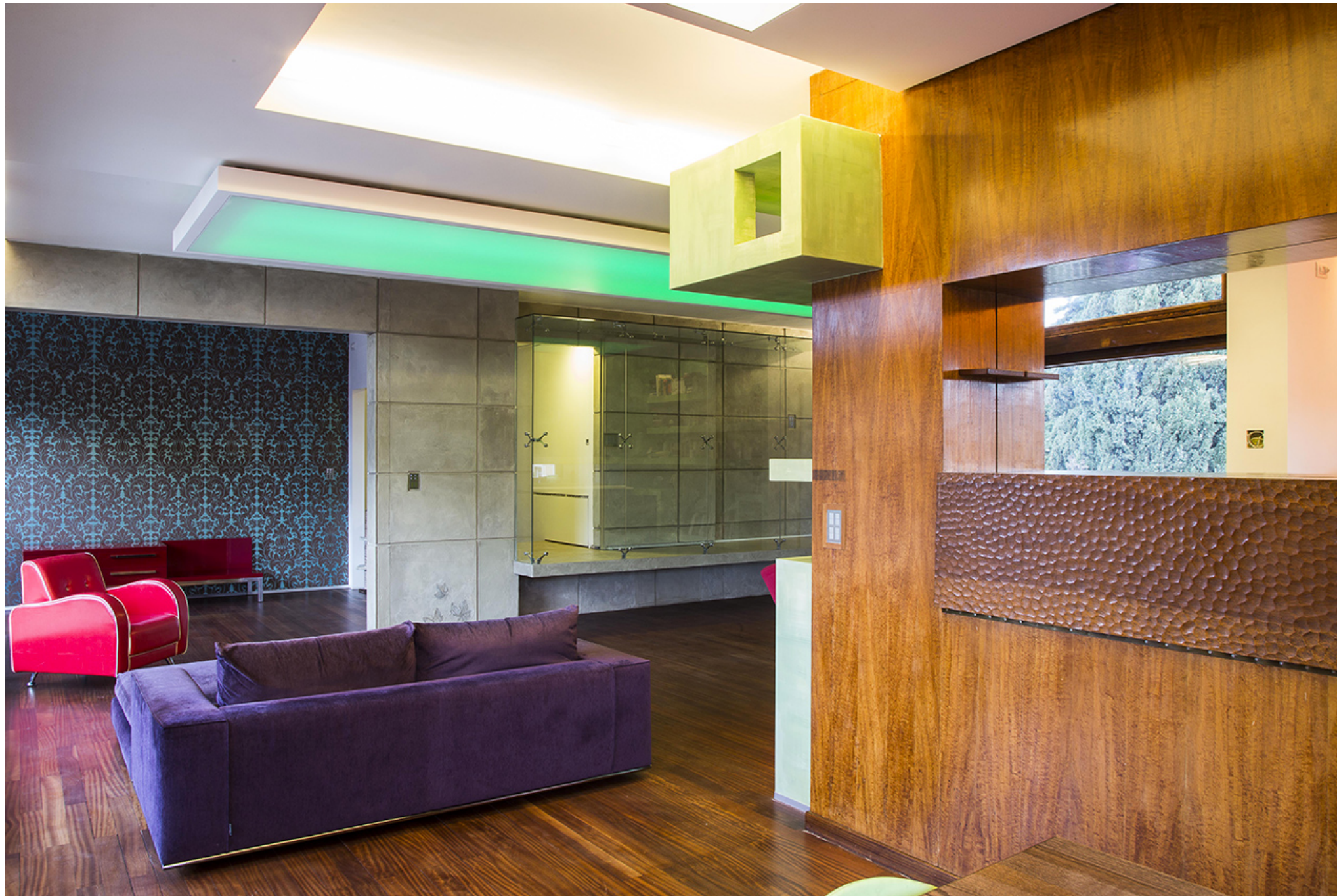
OfficinaLeonardo, 39-7 House

a uno spazio sospeso nel colore, fucsia, che avvolge, digerisce ed annienta tutto. Il cemento ben contrasta con il verde dello storico parco, di cui troviamo poi traccia e riflesso nelle pareti antistanti del salone ove emerge il secondo tema natale della casa, che si avviluppa come una pianta sul monumentale muro in conci di cemento: la natura organica e verde delle superfici e della articolazione dei volumi.